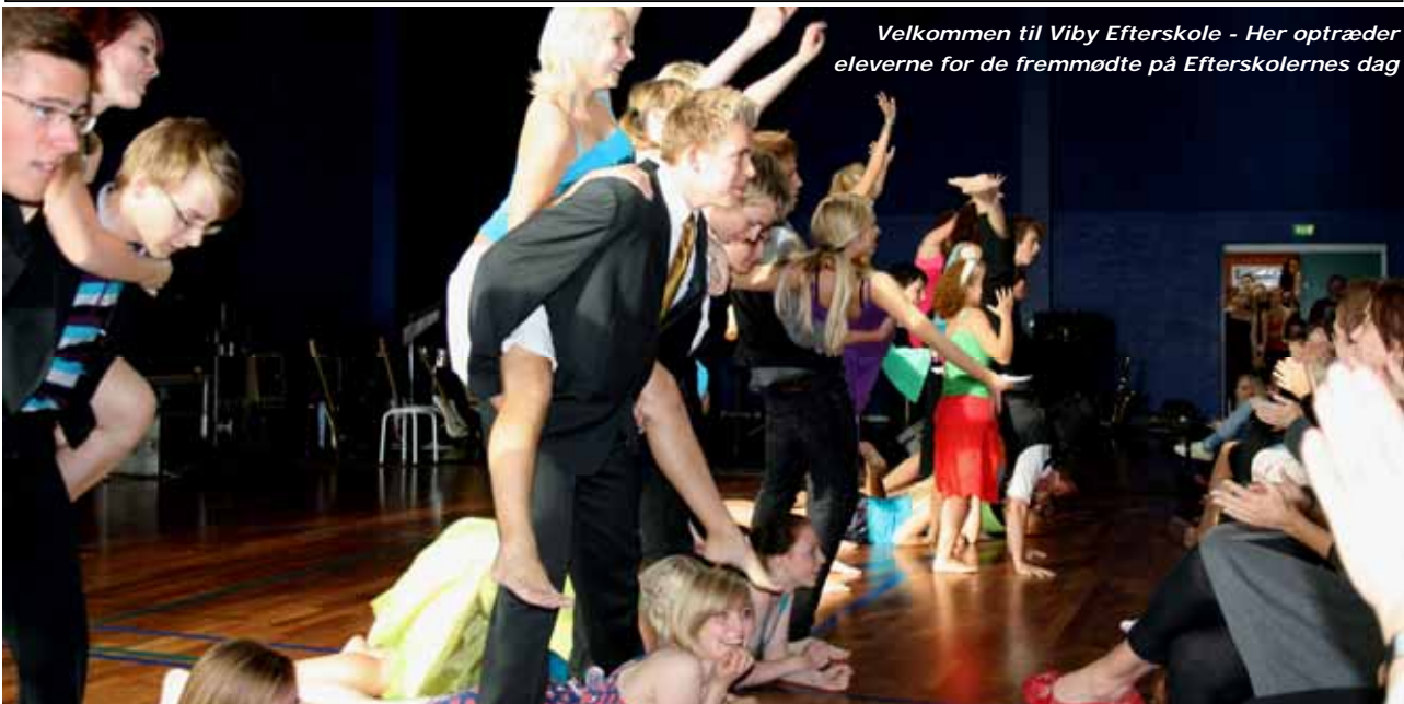
Velkommen til Viby Efterskole - Her optræder eleverne for de fremmødte på Efterskolernes dag