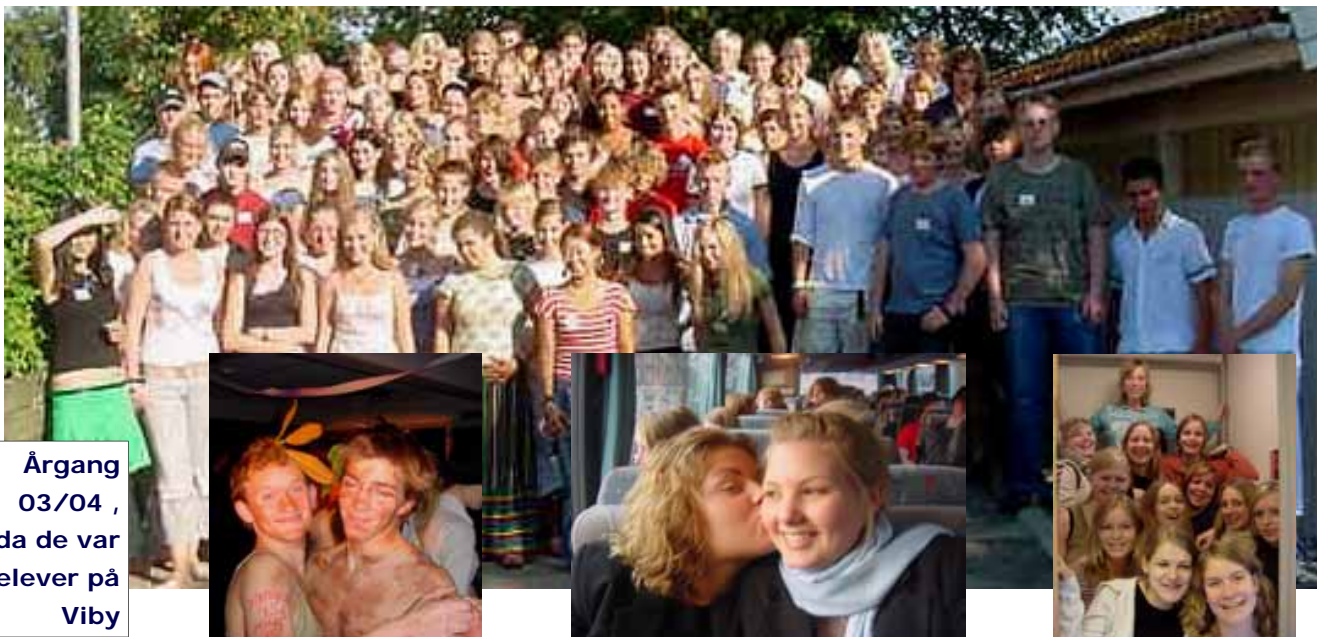
Årgang 03/04, da de var elever på Viby