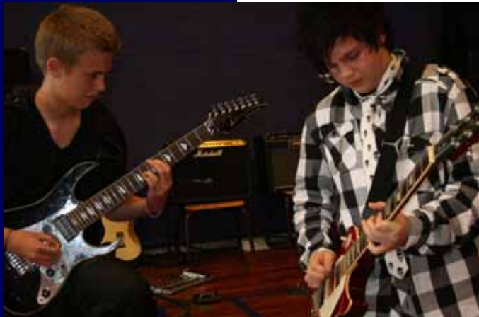
Af Eva X. Stockholm, 9. kl.

Sex er bandlyst på Viby. 'Drugs' er på samme måde som sex hjemsendelsesgrund. Men Rock'n'Roll, det er noget, vi har her.